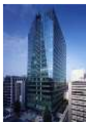
住友不動産 神田ビル